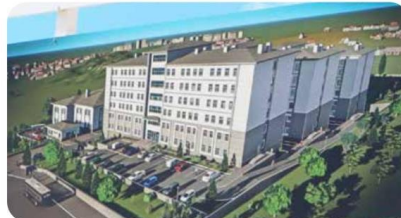
Yeni Yurt projesi